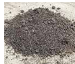
袋詰め堆肥 1袋15kg入り 300円(税込)