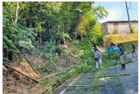
草刈りは9月頃までに終わらせる