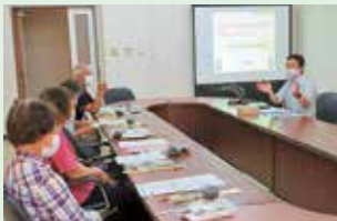
野間警部補によるうそ電話詐欺の講話