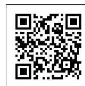
申し込みフォーム