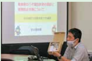
振り込め詐欺撃退装置の説明