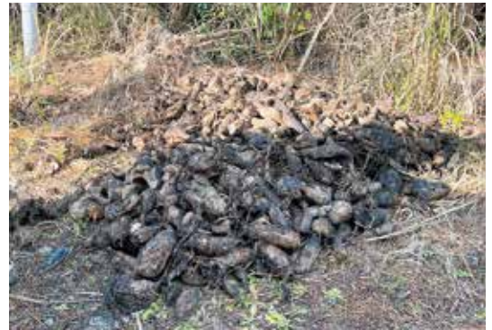
収穫残さを放置しない