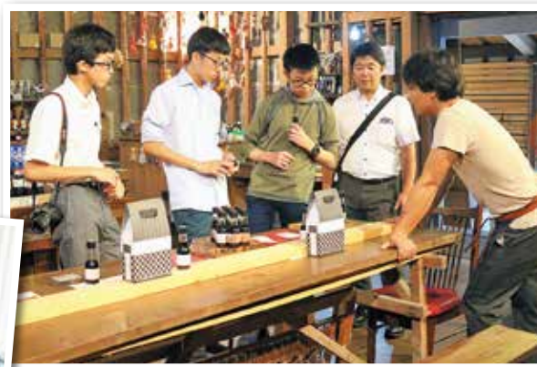
※写真は第1回スモチャレの様子です。