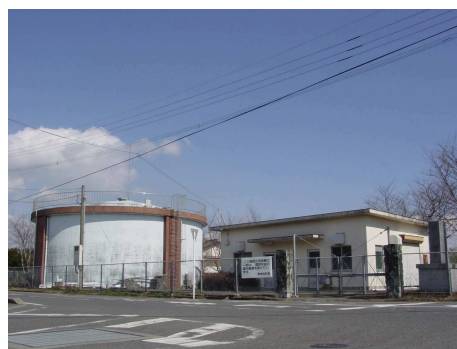
第1水源及び雪山配水池