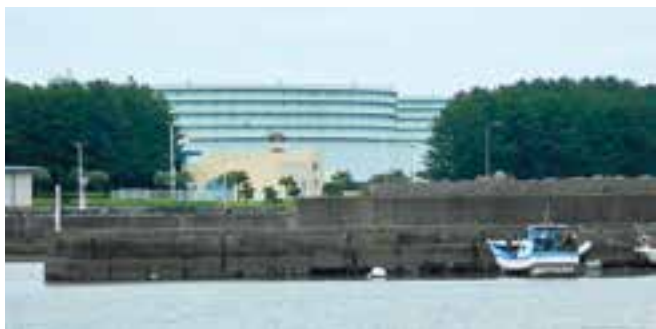
津波対策の協議会設立を望む