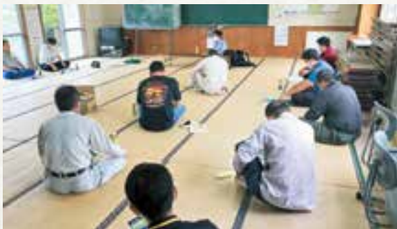
琵琶湖の研究者を招いた勉強会 (写真③)

放つておいては、大変なことになると危機感を持った農家の方々が東串良町南部みどりサークルにおいて、滋賀県琵琶湖の研究者の方を呼んで勉強会を開いた。(写真③)