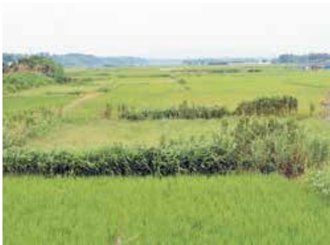
持留川地区のほ場整備を進められないか

ほ場整備に必要な条件だが、一つはほ場整備を推進する方々による同意の収集が必要である。他に実現可能な担い手への集積計画の策定等の条件整備に向けた取り組みが必要となる。そのため、地域全体でほ場整備を実施するという機運の高まりが重要となる。