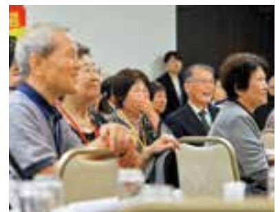
笑い声に包まれた会場内

西園 「新しい風を入れ、変わっていかないと東申良は駄目だ。行政も町長も変わらなくては。」という意見があったが、どう思うか。 町長 それは事実だろうと私も感じている。町に対する批判は甘んじてお受けするが、具体的にどのようなことを望んでいるのか。町長が変わるのは住民の皆さんの判断のため、答えようがないところだが、私なりに頑張っている。 西園 「女性の視点と感性が必要だ。町長も女性が出ればいい。」について、どう思うか。 町長 事実だろうと思う。男性とは違った優しい目線もあるだろうし、女性が出て、頑張っていたらだけばと思う。 西園 相撲道場のことについても、「年間余り使わないのにお金を充てるべきではない。」という意見もあるが、県外にいる町出身者の方はどう思っているか、話を聞いた