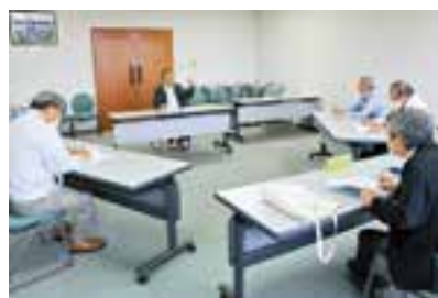
ピーマン・キュウリは単価がよかった

園芸振興会においては、新型コロナウイルスによる影響はないと思われるが、新規就農者やビニールハウス、機械の老朽化の問題があるため、引き続き調査の継続の必要性を感じる。