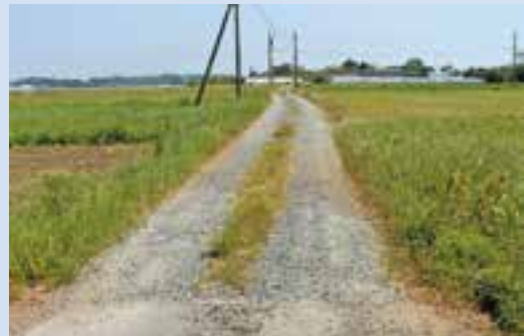
▲舗装がされておらず、道路の状況が悪い。(新川西上一集落の西側農道)