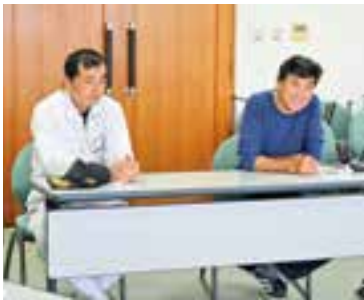
子牛、乳価も市場価格は下がっている