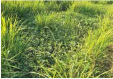
田んぼの中で繁殖 (写真①)

稲刈りの時、コンバインの刈り取り部に絡みついたり、あるいは脱穀部に貼りついて作業に大きな支障をきたす。