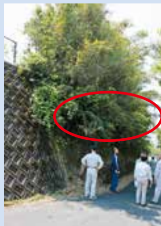
▲木の根などが露出し、がけ崩れの危険がある。(池之原小学校横の道路のり面)