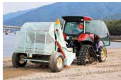
砂浜のゴミをビーチクリーナーで除去

組んだり、土壌改良剤や肥料を園芸に使用したり、柏原海岸の整備や清掃等、森林の保全、環境美化といったSDGsに特化しなくてもその考えでやっている。