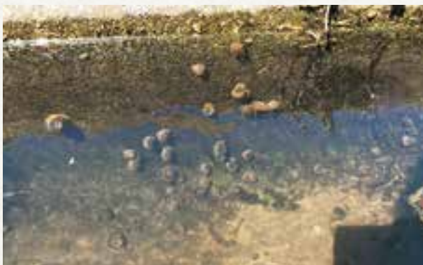
◀用水路や排水路まで侵入しているジャンボタニシ

あと、ジャンボタニシ、田んぼの水不足の問題への取り組みの要求もあつた。これらを町の皆さんにも知っていただきたく、報告申し上げたい。