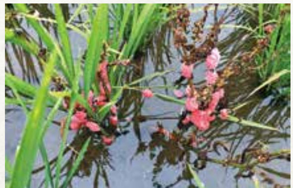
◀ジャンボタニシの卵