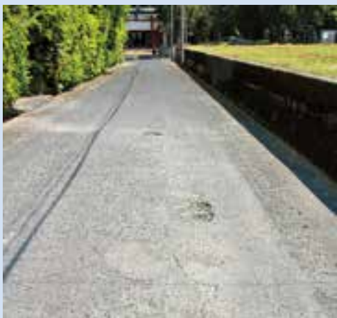
▲陳情採択後、ようやく今年度設計の予算がついた町道。(弁天新町線)