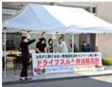
ドライブスルーでの弁当販売