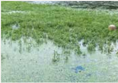
繁殖するオオバナミズキンバイ (写真②)

これは、最近、河川や湖沼にもはびこりだし、もともとそこにあつた在来の植物を駆逐したり、環境汚染を引き起こすなど世界的にも注視されるようになった。実際、町内の川東を流れる塩入川、下伊倉を流れる和田川にもその繁殖が確認されている。