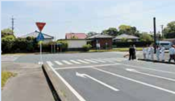
▲見通しが悪いか現場を調査。(俣瀬集落のT字の道路)