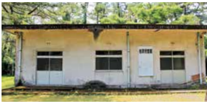
老朽化した児童館を取り壊し、跡地に円山公園管理棟を整備