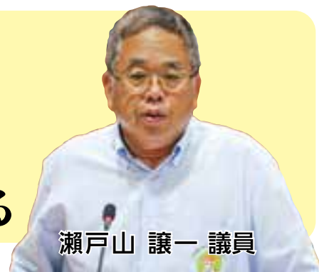
瀬戸山 譲一 議員

瀬戸山 今回のコロナで社会が大きく変容していくものと思われる。このコロナに対してどのような認識を持ったか。