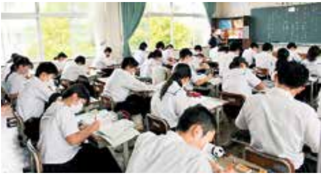
ぎゅうぎゅうに見えるなあ…。