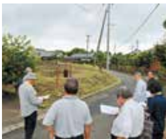
陳情内容を現地にて確認

町道大塚古市線は幅員が狭く車の離合が困難であるため、両側の側溝の蓋を落蓋式に変更すること、併せて側溝の排水能力の改善を要望したものです。