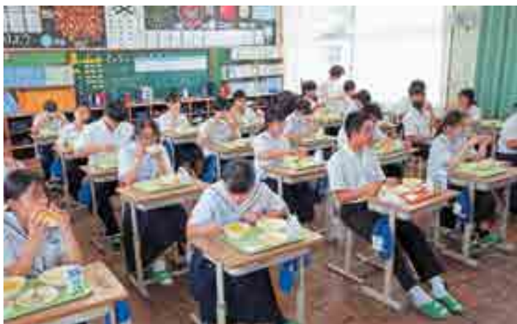
給食費の完全無償化を