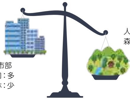
地方への配分が多くなるように

6月議会において当議会は、総理大臣等に対し譲与基準の見直しを要請する内容の意見書を提出することを全会一致で決めました。