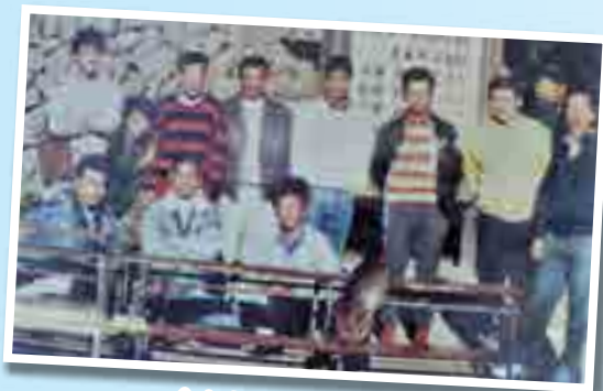
今から43年前に結成