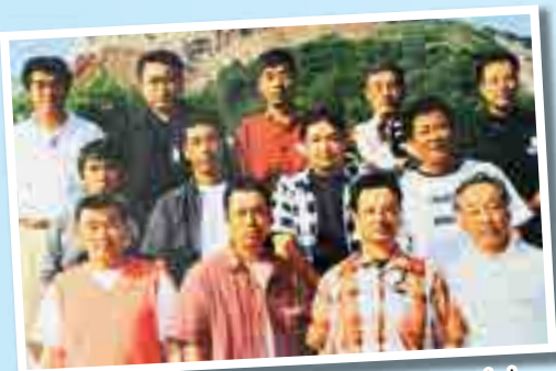
研修旅行での「思い出のワンショット」

ソフトボールの勝負にはあまり拘らず、試合後の反省会を楽しみに頑張り、いつしか持ち回りで、各家庭