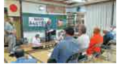
(川東北部地区の様子)