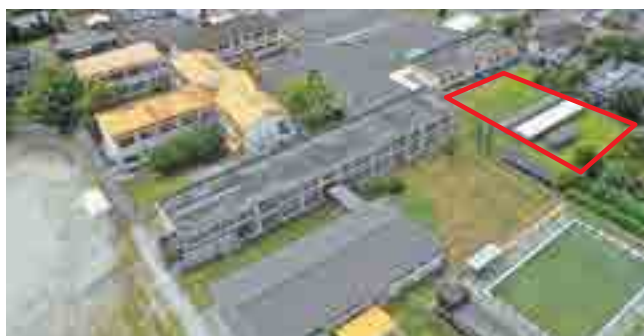
▲ □ 囲みがプールの予定地