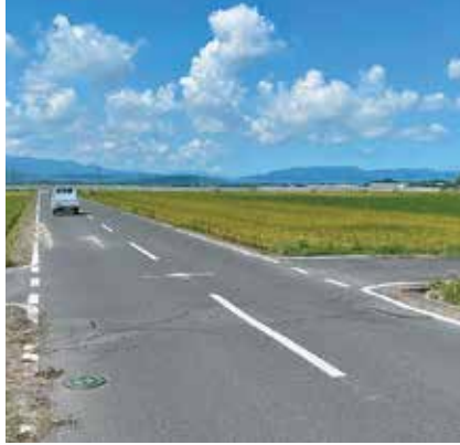
横断暗渠の段差解消工事を行う (西牟田雪山線)