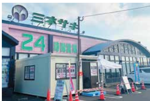
増設された期日前投票所(手前のプレハブ)

鹿児島県知事選挙期日前投票において、令和6年6月21日から24日の4日間フレッシュミニネサキ東串良店に投票所を増設した。