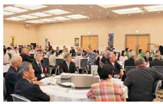
今後の東くしら会にも支援を