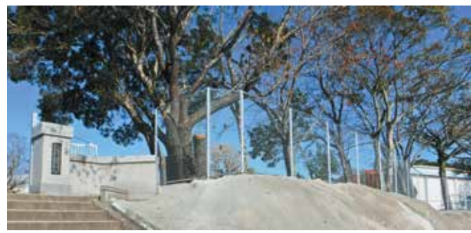
フェンスを2m高に更新（池之原小）

15 学校給食の食材調達には、町内産、県内産を積極的に活用し、食育活動も推進されている。