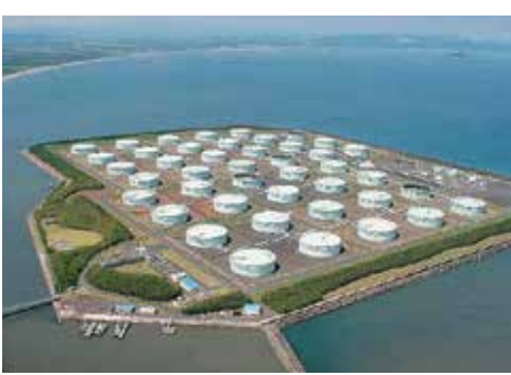
基地内には43基のタンクがある

43基のうち6基が肝付町の区域である。肝付町を含めた協議の場は必要と考えているが、既に協定があるので、協定に基づいて対応したい。