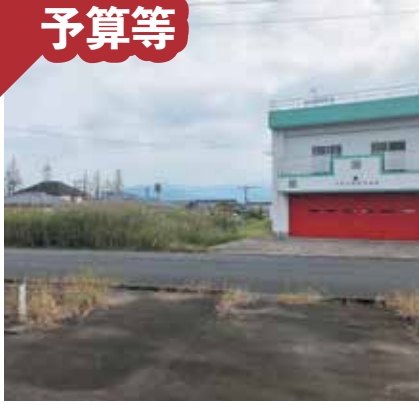
排水用の横断暗渠を設ける (豊栄大隅線)