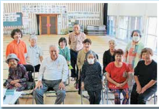
町老連カラオケ同好会