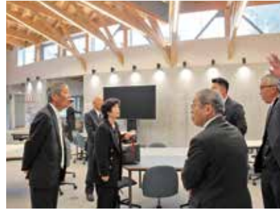
にしかわイノベーションハブ TRAS を見学

ることから、人口減少の根本対策として寛容性向上を重視している。この考え方が、『つなぐ政策』と『かせぐ政策』の柱となっている。