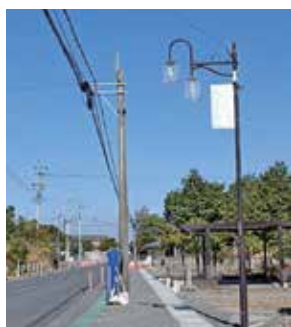
街灯の撤去等への補助を

毎年度の振興会交付金等を活用し、地域の合意の下、費用負担の在り方を検討してもらいたい。