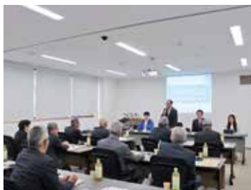
先進事例から学ぶ主権者教育

遊佐町の事例は、本町にも導入する価値が十分にあることを示している。ただし、本町には高校がなく、少子化により生徒数も減少傾向にあることから、本町の現状を踏まえ、導入する場合はより慎重により綿密に計画を行い、まずは小規模な試行プログラムとして開始し、参加者の声を聞きながら段階的に発展させていくアプローチが現実的であると思われる。 その際、町の特産品を活用した商品開発プロジェクトや地域の課題解決につながる企画など、子ども達に関心を持ちやすいテーマを設定するなど、より多くの参加を促すための工夫が必要となると思われる。