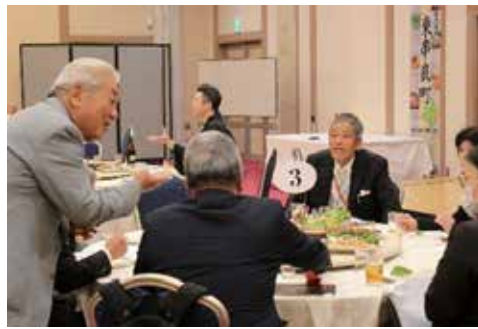
故郷の活性化を望む