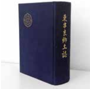
町の歴史を伝える郷土史

制90周年を迎えたが、町の郷土史は昭和54年までの記述であり、以降現在までの43年間は編纂されていない。いずれにしても、町制施行100周年を記念して発行できるよう準備していきたいと考えている。