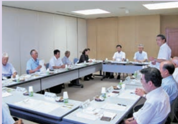
中種子町議会との意見交換

また、適正な議員定数や議員報酬のあり方についても協議し、有益な研修となりました。