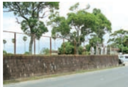
老朽化のため張替える (町民運動場南側フェンス)

一般会計繰越明許費繰越計算書(事業費の合計2698万円)について、報告があった事業は次のとおりです。 ● 過疎地域等自立活性化推進事業 ● 橋梁長寿命化修繕計画策定事業 ● 古市団地補修事業