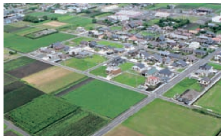
安心安全の施策に総合病院の誘致を望む（定住化事業の池之原地区）

事業や人口増対策のためになるとの発想のもと、施策として取り組もうということだったと私は記憶しています。当時、企業誘致調査特別委員会が設置され、私はその委員長として活動していました。福祉企業の誘致と思い、議長とともに懸命に取り組みしました。この医療機関の誘致は今後も必要だと思っています。このような観点から、今後、医療機関の進出について町長はどのように考えているのかお聞きします。