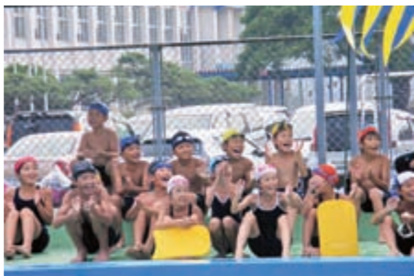
級友に大きな声援をおくる（両小水泳記録会）

す。これは障がい児と健常児を集団保育することにより、障がい児の健全な成長や社会性の発達を促進し、福祉の増進を図る目的で行っています。 また、障害児福祉手当を受給しているお子さんを扶養し介護または看護している方に、介護者福祉手当を支給しています。これは月額8,000円支給し、24年度には4人に38万4000円支給しています。 さらに重度心身障害等の知的身体障害者に対して、年4回紙おむつを支給していま