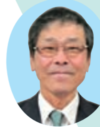
前田 隆 議員