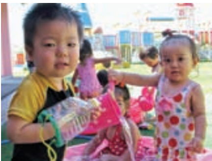
のびのびと育てね

新制度では、市町村が回収ボックスなどを設置して、小型家電を集めて業者に引き渡します。そして、処理施設などで金・銀と16種類ぐらいに分けて、金属を取り出します。排出者やメーカーに負担がなく、取り出した資源を販売すれば、事業として採算がとれるような想定もあるそうです。ところが、非常に参加に慎重な自治体が多いようです。そこで、本町の取り組みをお聞かせします。