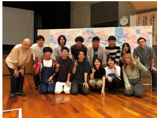
鹿児島大学建築学科柴田研究室のみなさん

表紙に掲載している写真の模型は、柴田研究室がこの日のために制作したものです。東串良町の地形（高低差）と位置関係がわかる、この模型があることで、町のことがイメージしやすくなりました。